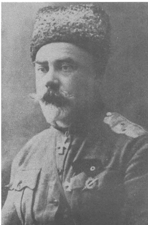
Ген. А. И. Деникин